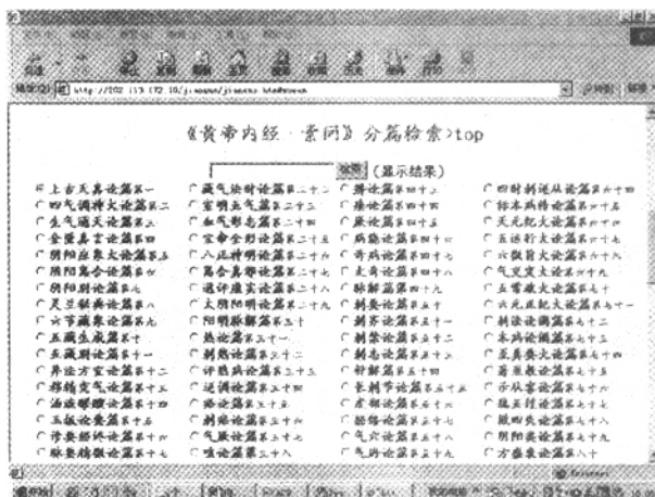
图 2 《黄帝内经》分篇检索页面