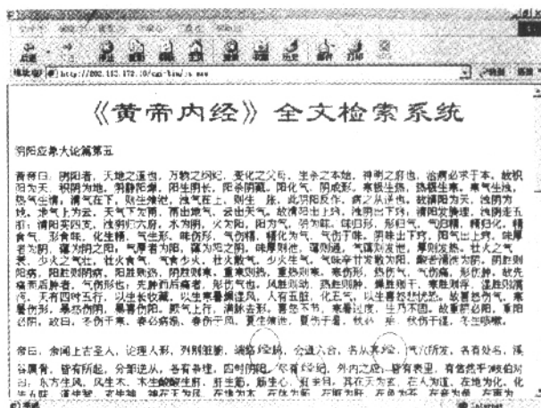
图 4 《黄帝内经》分篇检索输出结果